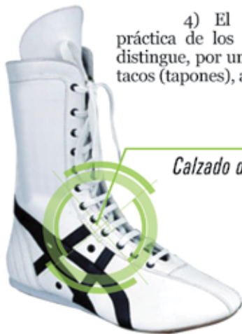
Calzado de Lucha libre

4) El calzado especial para la práctica de los deportes, entre los que se distingue, por una parte, el que tiene clavos, tacos (tapones), ataduras, tiras o dispositivos