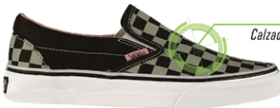
Calzado tipo vans

b) Los calzados similares a los del inciso a), concebidos para actividades recreativas (por ejemplo, "top siders", "vans", etc.), ni los llamados "tenis casuales" o "calzado casual", aún cuando pudieran utilizarse indistintamente para la práctica de las actividades descritas en el inciso a) anterior."