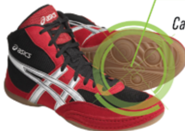
BOX: Calzado provisto de pasadores hasta el extremo, sin tacos con suela suave.

CICLISMO: Calzado con aditamentos especiales para sujetarse al pedal de la bicicleta. Este calzado presenta una suela que comprende una base de un material suficientemente duro para resistir la penetración del pedal además de que cuenta con sobre-espesores que sobresalen de esta base en las zonas del talón y de las partes delanteras de la suela.